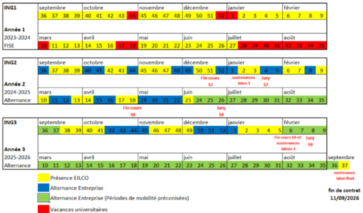
Figure 3 : Calendrier d'alternance (2023-2026) pour les alternances de CING2 incluant les périodes de mobilité préconisées.

Une convention de mobilité sera établie afin de préciser l'ensemble des conditions liées à cette mobilité.